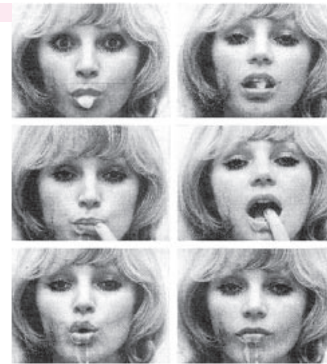
▲ Post-Consumer Art | 1975 | Photography