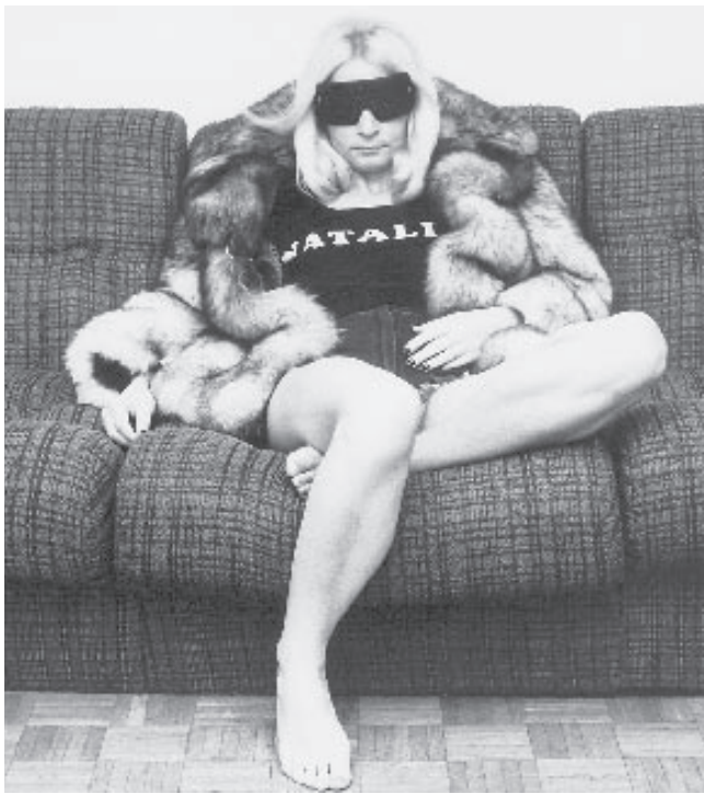
▲ Animal Art | 1977 | Self-portrait | Photography