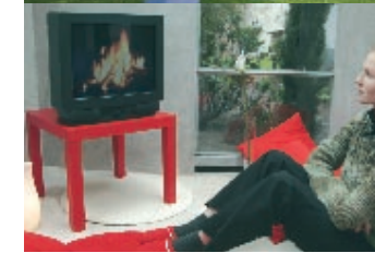
▲ Knocking on Heaven's Door | 2004 | Privatgrün | Köln, 2004

A touch of poetry that flows through James Bond, dreams of music-hits and artificial paradises in the way that it gives them and takes away their illusion at the same time.