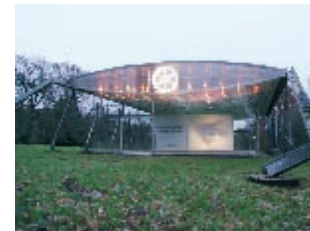
▲ Magic Garden | 2000 | Heidelberger Kunstverein | Heidelberg 2001 ▲ The temple of Ra - or - The eyes of T.J. Eckleburg | 2001 | Wewerka Pavillon | Münster