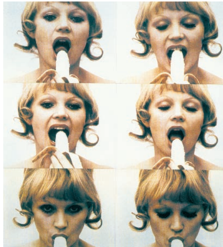
▼ Consumer Art | 1972 | Photography