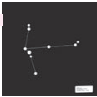
▲ Points of Support | Constellation Eagle | 1979 | Photography

„Natalia Lach-Lachowicz, die sich selbst Natalia LL nennt, ist die bedeutendste und international renommierteste Künstlerin Polens. Bereits in den siebziger Jahren füllten Bilder ihrer „Consumer Art“ die Seiten internationaler Kunstzeitschriften; ihre Fotoserie einer suggestiv und zweideutig Banane essenden Blondine erregte in 1975 auf der 9. Biennale der Jungen Kunst in Paris die Gemüter.