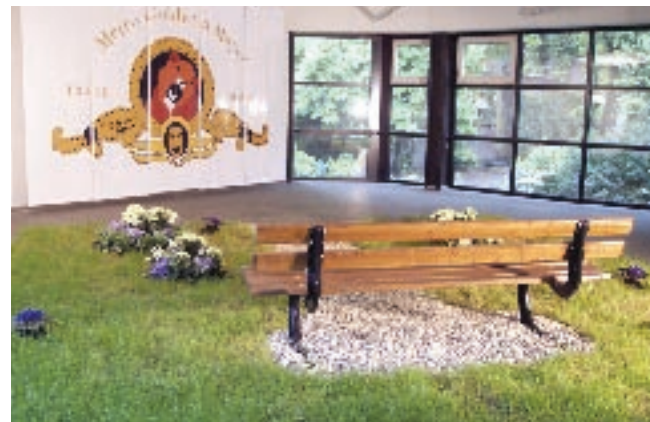
▲ Happy End | 2002 | Kunstverein Gelsenkirchen | Gelsenkirchen 2002