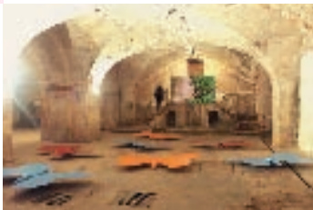
▼ A breeze of fortune | 2002 | Museum für Zeitgenössische Skulptur, Oronsko 2002 | Centre d'art contemporain, Albi 2004

„Sie richtet James Bond ein kühles Designer-Büro ein - und will selber mitspielen. Deshalb erfindet sie jene konspirative Organisation